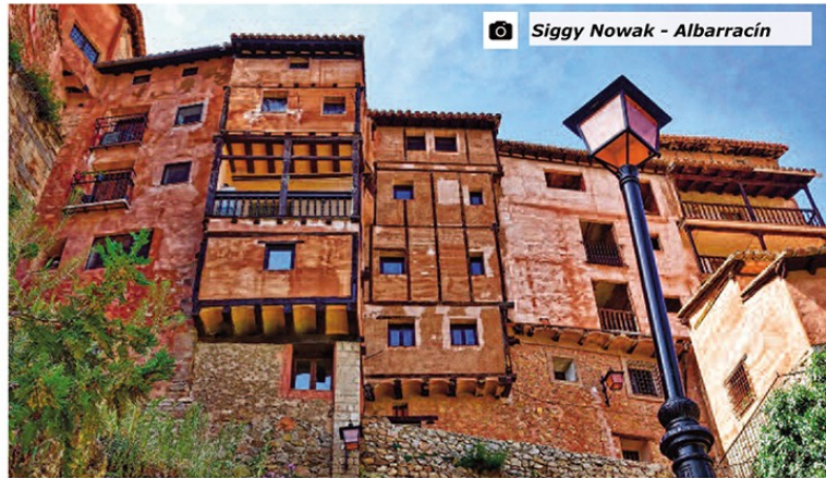
Siggy Nowak - Albaracín