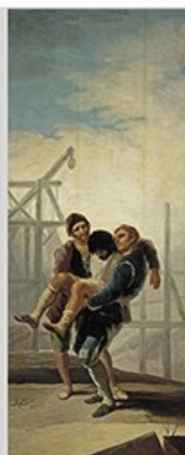
El albañil herido es un cuadro de Francisco de Goya perteneciente a la tercera serie de cartones para tapices, ejecutada entre 1786 y la muerte de Carlos III en 1788.